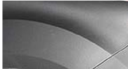
Magnetic Grey Metallic