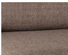
+ Tapicerka Tarragona ○