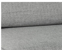
+ Tapicerka Amposta