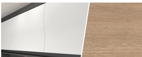
+ Elementy dekoracyjne z drewna Amberes Oak