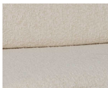
+ Tapicerka Tropea