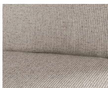
+ Tapicerka tekstylno-skórzana Heron