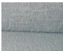
+ Tapicerka Drake