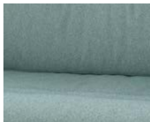
+ Tapicerka Badalona ○