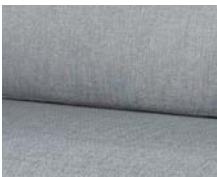
+ Tapicerka Amposta