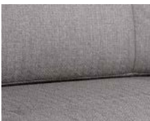
+ Tapicerka Tarragona ○