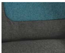
+ Tapicerka Salerno z pokrowcem na fotel kierowcy i pasażera