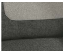
+ Tapicerka Calypso z pokrowcem na fotel kierowcy i pasażera