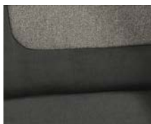
+ Tapicerka Ravello